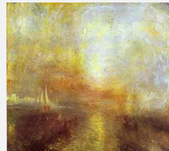
William Turner, Late aproximando-se da costa , 1835

Seguidamente, tendo como ponto de partida a abordagem da pintura em França, Inglaterra e Alemanha, analisou-se, com detalhe, algumas das obras mais significativas dos pintores que se destacaram nesses países, a saber: os franceses Antoine-Jean Gros, Théodore Géricault e Eugène Delacroix; os ingleses John Constable e William Turner e o alemão Casper David Friedrich. Como é habitual, houve uma inter-acção viva entre todos os presentes e o agrado pela pintura de Turner foi manifestado por alguns de nós. A análise da pintura romântica em Portugal será feita na próxima sessão.