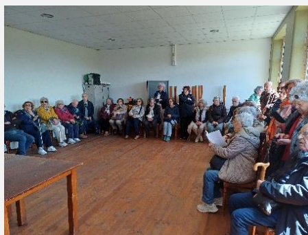
Recepção em Cambedo da Raia

No dia 14 de manhã decorreu a visita à aldeia de Cambedo da Raia que, entre 1936 e 1946 deu abrigo a refugiados galegos e espanhóis perseguidos pela ditadura franquista. Percorremos a aldeia com um guia local que nos contou toda a história e nos mostrou sinais existentes do cerco e bombardeamento de Cambedo no dia 21/dez/1946 (ver na NET notícias detalhadas dos acontecimentos e da homenagem recente da Assembleia da República).