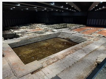
Termas Romanas de Chaves

Em suma: momento cultural, de revisitação histórica, de agradável convívio